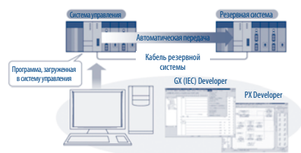
Резервированная система System Q автоматически синхронизирует программы между двумя системами.

Каждую систему System Q можно спроектировать с необходимой для данного при-