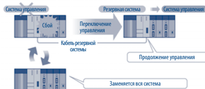
При сбое переключение на резервную систему происходит в течение всего 22 мс.

Основой резервированной конфигурации System Q являются два отдельных ЦП управления процессом (QnPRH), связанных между собой и выполняющих функции активной и резервной систем. Конфигурации обеих систем идентичны, что обеспечивает полностью резервированный состав и позволяет их устанавливать одним из двух способов.