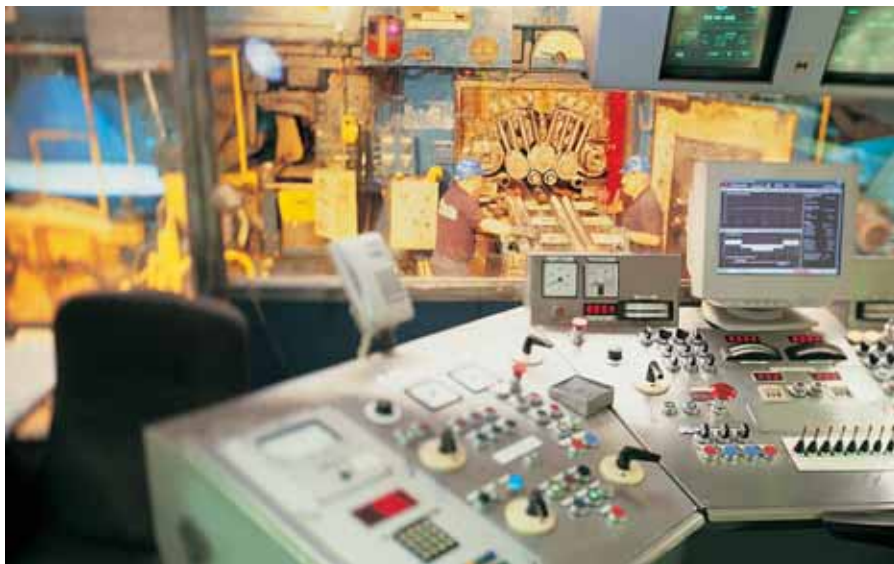
Резервированная система System Q предназначена для обеспечения безотказности производственного процесса.

Резервированная система System Q представляет собой гибкую альтернативу традиционной распределенной системе управления (DCS). В состав системы System Q входят обычные модули ПЛК, доказавшие свою высокую надежность, расширенная сетевая структура и отдельный резервный ЦП.