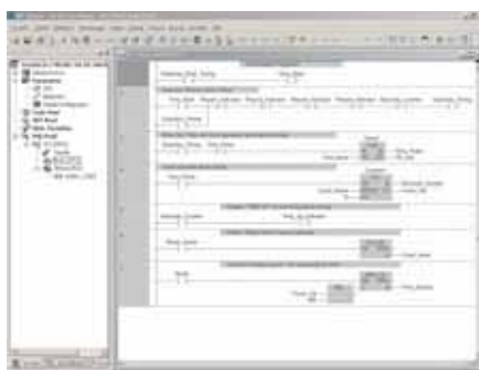
GX (IEC) Developer

Резервированные ЦП серии System Q можно программировать с помощью разных средств: GX Developer – для управления очередностью выполнения операций,