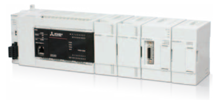
Дополнительные модули для ваших задач

Реальное положение серводвигателя можно определить путем регистрации меток, отпечатанных на пленке, движущейся на высокой скорости. Компенсация позиции оси резака на основе регистрации меток сохраняет постоянное положение резки.